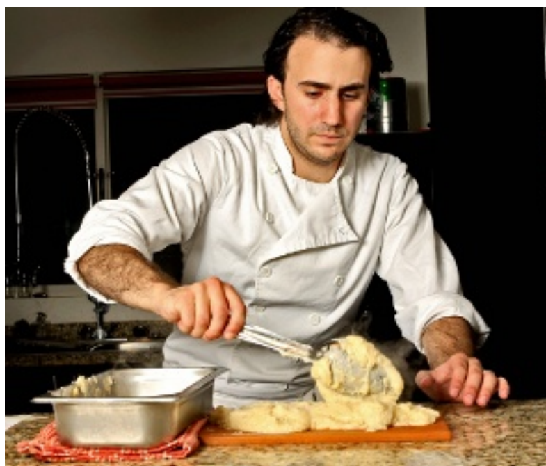
► Dice que en su casa cocina a diario, lo que le ayuda a practicar sus creaciones.

Dice que no estudió para chef porque aun cuando tiene 26 años, en ese tiempo no había una escuela for-